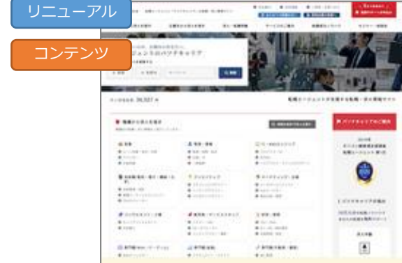
株式会社パソナ様事例 「流入数の倍増に成功した大規模求人サイトのSEO対策事例」