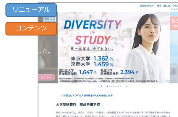
学校法人 駿河台学園 様 「リニューアルで全体最適化！新たなニーズ獲得に成功したSEO事例」