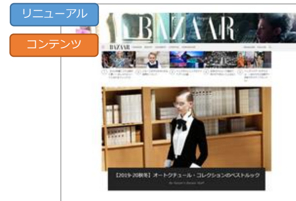
株式会社ハースト婦人画報社 様 「ハーパズ バザー」ドメイン+URL変更の大リニューアルで流入減とならず増加したSEO事例