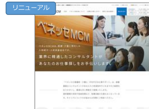
株式会社ベネッセMCM様事例 「職種ごとに最適化した医療系求人サイトのSEO対策事例」