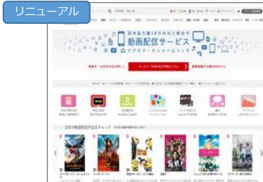
株式会社ビデオマーケット様事例 「スマホの流入最大化のためにPCサイトを最適化 動画SEOのベストプラクティスへの取り組み」