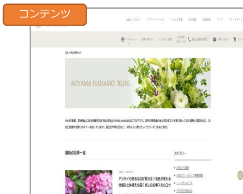
株式会社 青山花茂本店 様 「老舗生花店ならではの質の高いコンテンツSEOで流入4.8倍、売上1.5倍に」