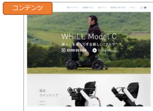
WHILL株式会社 様 「SEOを意識したコンテンツマーケティングで流入獲得した事例」