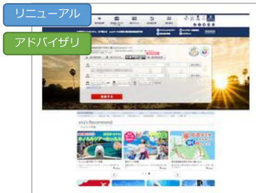
エアプラス株式会社 様 「リニューアル施策+長期のSEOアドバイザリサービスで着実に流入を伸ばした事例」