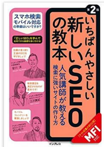
いちばんやさしい 新しいSEOの教本第2版 (2018年7月20日発売)