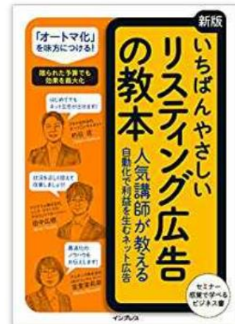
いちばんやさしい リスティング広告の教本新版 (2018年10月19日発売)