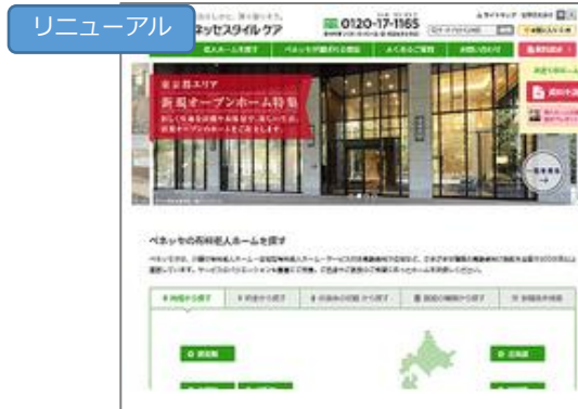
株式会社ベネッセスタイルケア様事例 「カスタージャーニーに基づく徹底的なニーズ調査からサイトを全面刷新」