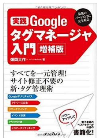
実践 Google タグマネージャ入門 増補版 (2015年5月22日発売)