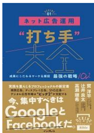
ネット広告運用“打ち手”大全 成果にこだわるマーケ&販促 最強の戦略102 (2018年4月13日発売)