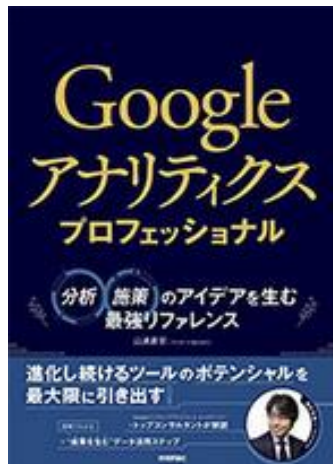
Googleアナリティクス プロフェッショナル (2020年4月17日発売)