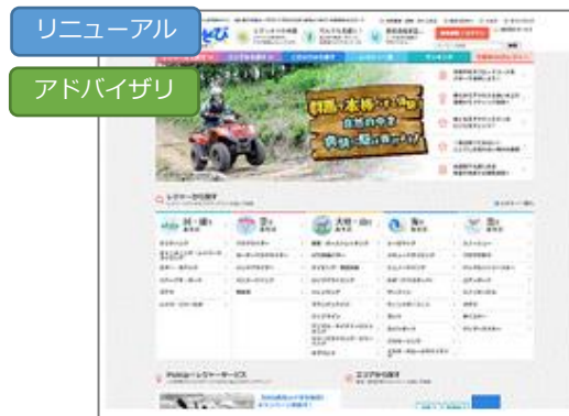
株式会社そとあそび様事例 「SEOとユーザビリティ 両観点からサイト全体を徹底的に最適化」