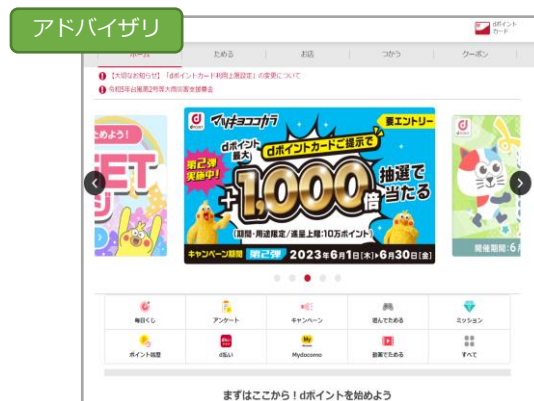
株式会社NTTドコモ dポイントクラブ 様 「ドメイン統合&Googleインデックス削除による流入減を解決した事例」