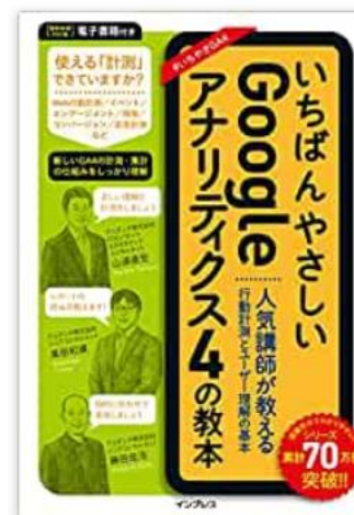
いちばんやさしいGoogleア ナリティクス4の教本 (2022年8月26日発売)