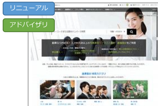
ピクスタ株式会社様事例 「スピーディーなSEOコンサルティングと自社開発でサイトを抜本的に改善」