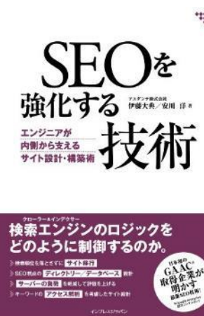
SEOを強化する技術 エンジニアが内側から支える サイト設計・構築術 (2009年12月18日発売)