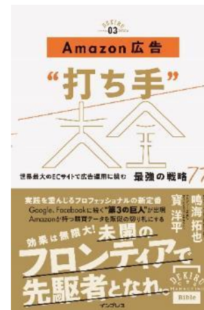
Amazon広告運用“打ち手”大全 (2019年4月19日発売)